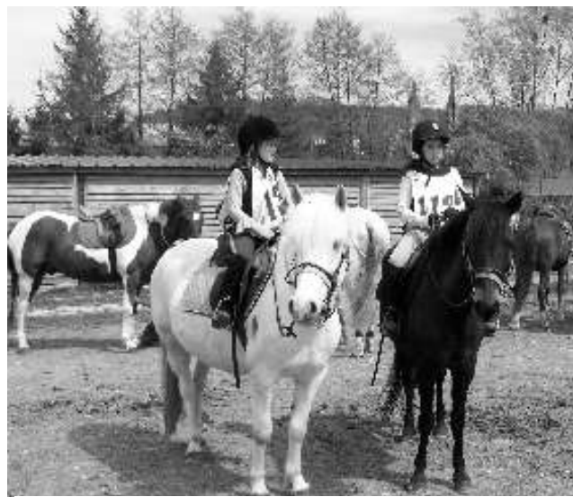
Photo du club

L'Etrier de Bretoncelles Les Ecuries de Sagittaire Montras, Bretoncelles.