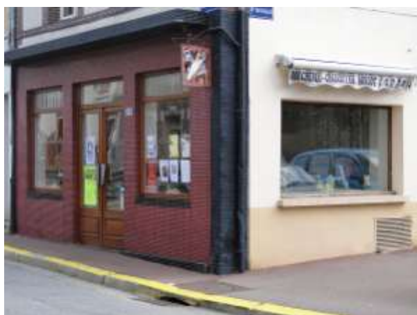
La boucherie avant travaux.

Rendez-vous début décembre, date des premiers coups de pioche.