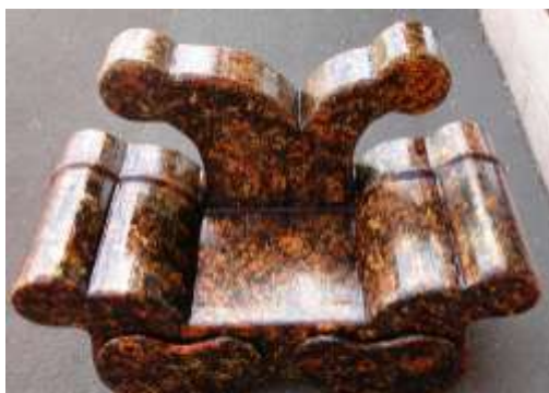
Un fauteuil enfant, d'une solidité étonnante

montre un fauteuil pour enfant avec deux tiroirs. Ce professionnalisme a été acquit après 600 heures de formation. Et comme Claude entend persévérer pour devenir formateur, elle doit compter 1600 heures de formation pour obtenir son agrément.