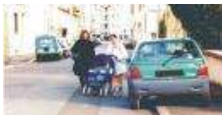
Plus jamais ça

Attention à la gendarmerie qui pourra verbaliser les contrevenants, même si l'objectif communal est avant tout de prévenir et de sécuriser.